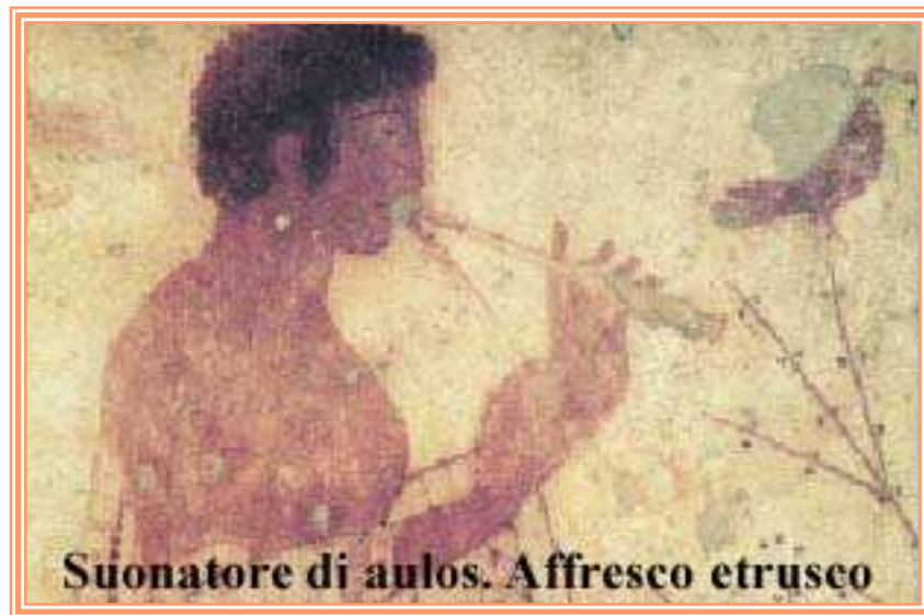
Suonatore di aulos. Affresco etrusco

Gli auleti suonavano usando la respirazione circolare